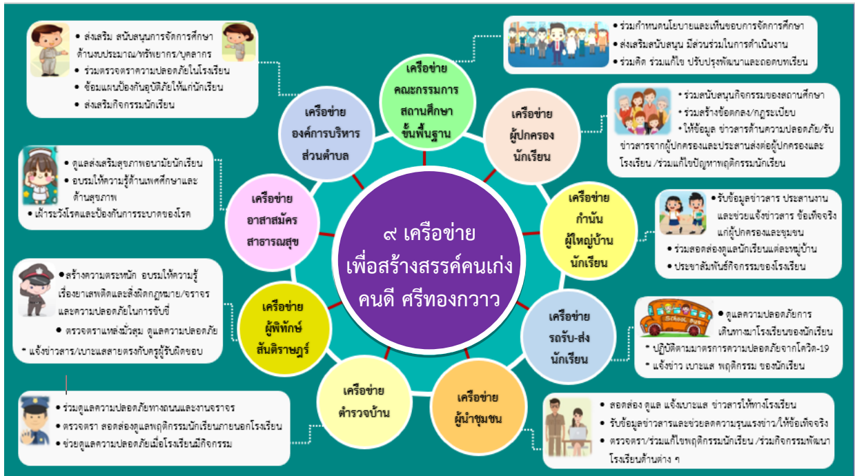
แผนภาพ 9 เครือข่ายเพื่อสร้างสรรค์คนดีคนเก่ง ศรีทองกวาว

2) ร่วมวางแผน มีการวางแผนการดำเนินการร่วมกัน ตามการจัดประชุมเพื่อออกแบบการมีส่วนร่วม จาก 9 เครือข่ายของโรงเรียนทุ่งกว่าวิทยาลัย เพื่อกำหนดบทบาท และร่วมกำหนดโครงการ กิจกรรมที่ สอดคล้องกับแนวทางการพัฒนาคุณธรรมของผู้เรียน