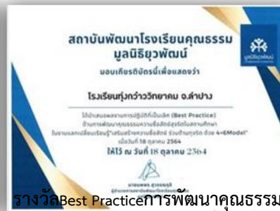
รางวัล Best Practice การพัฒนาคุณธรรม