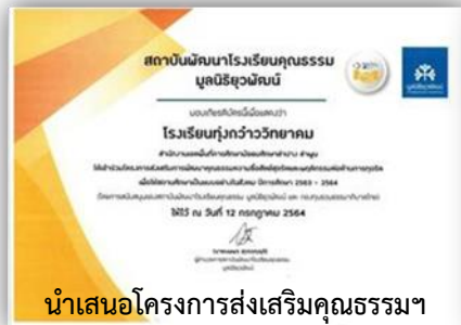
นำเสนอโครงการส่งเสริมคุณธรรมฯ