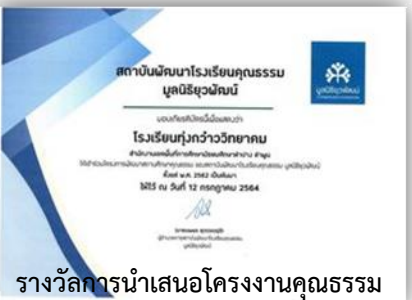
รางวัลการนำเสนอโครงการงานคุณธรรม